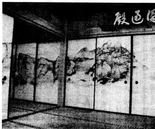
新たに制作された本堂の襖絵