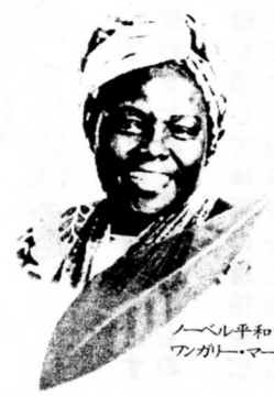
ノーベル平和賞受賞者 ワンガリ・マタイさん

「もったいない」は、世の中の事々物々すべては、みな互いに持ちつ持たれつの関係でこそあれ、それ自身単独でわが本体とすべき存在ではないという仏教の基本的な考えかたを示しています。 つまり、「ものがなくなる」という物的損失を惜しむ気持ち以上に、失ったものを手にしたり、完成させたり、そこにたどり着くまでの「形には表れない大切なもの」に馳せる感謝の気持ちがあるのです。