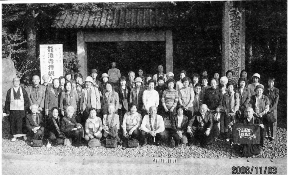
龍潭寺総門前で参加者の善男善女

屋食は彦 根随一の料 理旅館「や す井」大広 間で、脇息 でくつろぎ ながら、御 馳走を頂き ました。さ すが老舗の 旅館だけあ って調度も すばらしく 一時を忘れ ました。来 年からは、 副住職夫婦 が修養会を 担当します 新しい感覚 できっと、 楽しい会に にしてくれ ることだと 存じます。