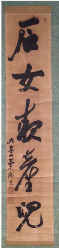
蘭洲和尚墨跡 インターネットオークション落札