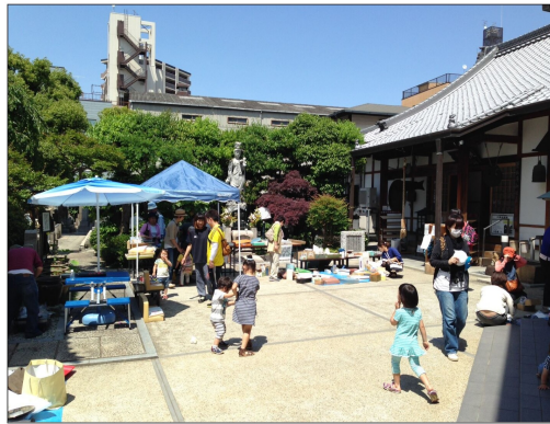
チャリティーバザー風景